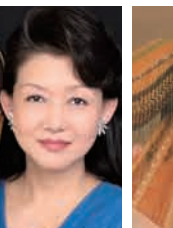
ヨセフ・モルナル (音楽監督)